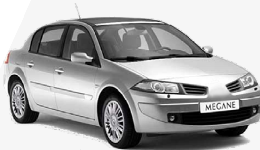
Megane II (Sedan) Modelo: 2003 al 2008