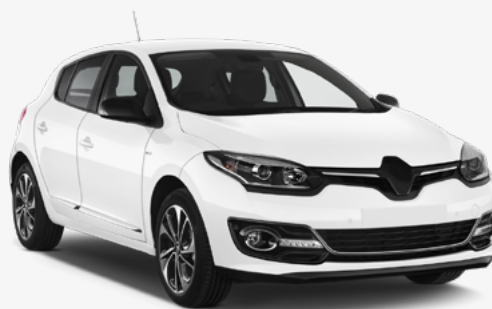
Megane III Modelo: 2008 en adelante