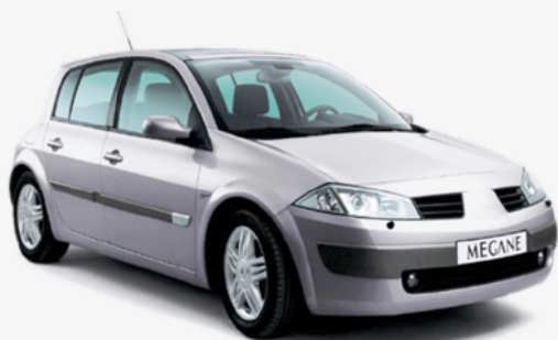
Megane II (Hatch) Modelo: 2003 al 2008